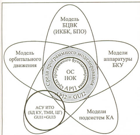
Рис. 2. Архитектура НОК БПО с обозначениями: БЦВК – бортовой цифровой вычислительный комплекс; ИКБК – интерпретатор команд бортового компьютера; БД КУ – база данных команд управления; ТМИ – телеметрическая информация; ЦГ – циклограммы испытаний; АСУ ИТО – АСУ испытаний и телеметрической обработки; GUI1 – штатный интерфейс; GUI2 – отладочный интерфейс; GUI3 – технологический интерфейс

ПО подсистем и БПО в целом в составе подсистем на инженерных моделях и летном изделии. Часть используемых методов рассмотрена выше в рамках гарантирования качества компонент.