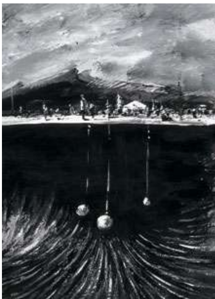
Рисунок: Константин Батынков

Нейтринный телескоп, развернутый в глубине озера Байкал, не только позволяет разобраться с тем, что происходит в других галактиках, но и запускает новые технологические направления, находящие применение в самых разных сферах — от нефтянки до военки